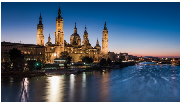
Nuestra Señora del Pilar - Zaragoza