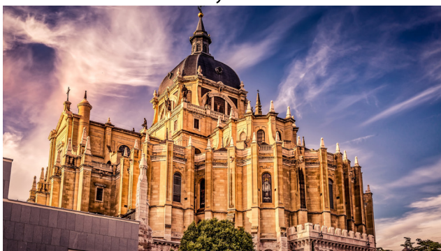
Catedral de la Almudena - Madrid